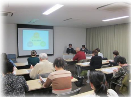
認知症サポーターの証として オレンジリングをお渡ししました

今後も皆さんの活動のプラスとなる研修会を企画しますので、ぜひご参加ください。ご希望のテーマ等もどしどしお待ちしております。