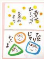
「筆ペン絵手紙」~色筆ペンで想いを伝える~