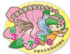
協力事業者ステッカー