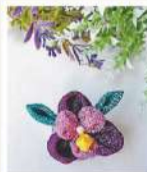
「つまみ細工」~あやめのプローチ~