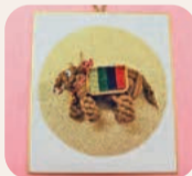
「マクラメ編み」~干支色紙・丑~