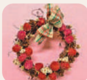
「リース」~自然の物を使って~