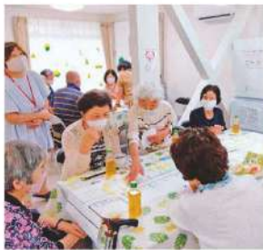
▲昔を語ろう！あの店この店！

えがおは昨年1月に開設して1年が過ぎました。日頃はふらっと立ち寄れる居場所として、時にはイベントを開催して、みなさんと楽しい時間を過ごしてきました。目の前には三条公園があるので、子どもたちにとってもホッとできる居場所になればと思います。来て下さった方が、笑顔でお越しくださって、お帰りの際にはもっとすばらしい笑顔になれば嬉しいです。様々な世代の方が交流できる安心、安全な、そして大切な居場所として発展していけるよう、みなさまからの温かいご指導をどうぞよろしくお願いいたします。