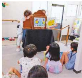
▲子ども向けイベント