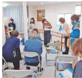
▲フレイル予防講座