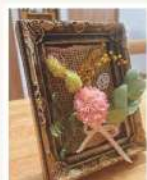
「アロマ香るフラワーアート」~お好きな香りで~