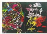
「スクラッチアート」~削るだけのカラフルアート~