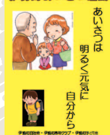
あいさつ運動ポスター

伊勢町の名称は江戸時代、お伊勢さん参りの費用を捻出するために開いた「伊勢講西新田」が由来と云われています。世帯数878戸、人口2017人、自治会への加入率は78.4%で、マンション・集合住宅の方が約60%、一戸建ての方が残り40%となっています。