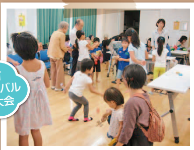
伊勢町フェスティバルけん玉大会

また、「伊勢町ナイスガイクラブ」メンバーによる月2回の夜回りや週2回の下校時見守りも6年目となりました。今年はあいさつ運動から一歩踏み出して、ご近所での「声掛け運動」で地域が住みよい、助け合いの広がる町になればと思っています。