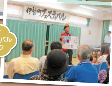
伊勢町フェスティバルマジック