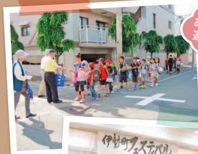
あいさつ運動声掛け