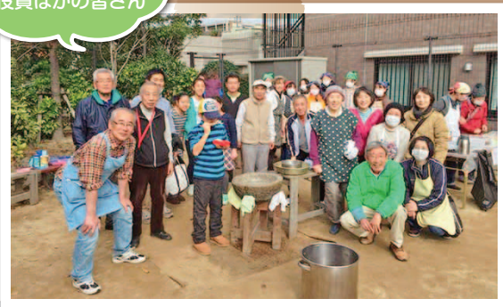
おもちつき大会役員ほかの皆さん