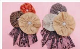
ヨーヨーモチーフのブローチ