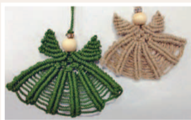
「マクラメ編み」～天使のアクセサリー～