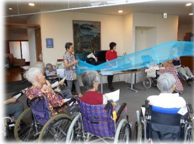
レクリエーションの補助(音楽療法)

ご利用者のみなさんと一緒に歌を歌ったり、歌詞カードの配布をします。この日は夏の歌を歌い、手づくりの波も登場し、盛り上がりました。