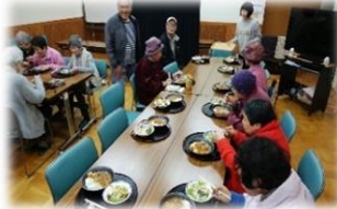
わいわい食堂の様子

活動内容 ①会場設営（テント張り・提灯付け等） ②わいわい食堂での配膳作業 （調理・盛りつけは活動には含みません）